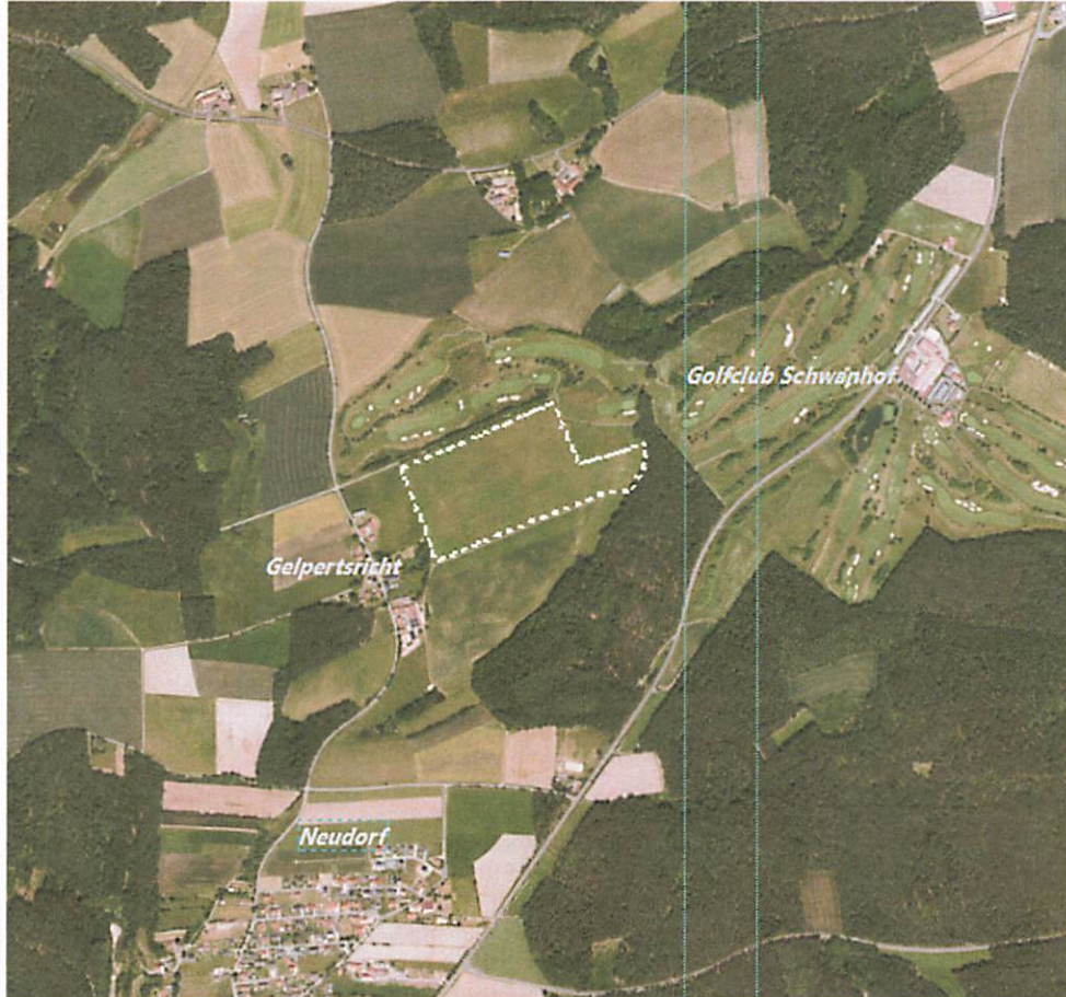
Lageplan des Änderungsbereiches

Der Änderungsbereich hat eine Größe von ca. 8,7 ha und liegt östlich von Gelpertsricht. Er umfasst das Flurstück 1186 der Gemarkung Neudorf b. Luhe. Die Lage und der Flächenumfang sind dem beigefügten Lageplan zu entnehmen.