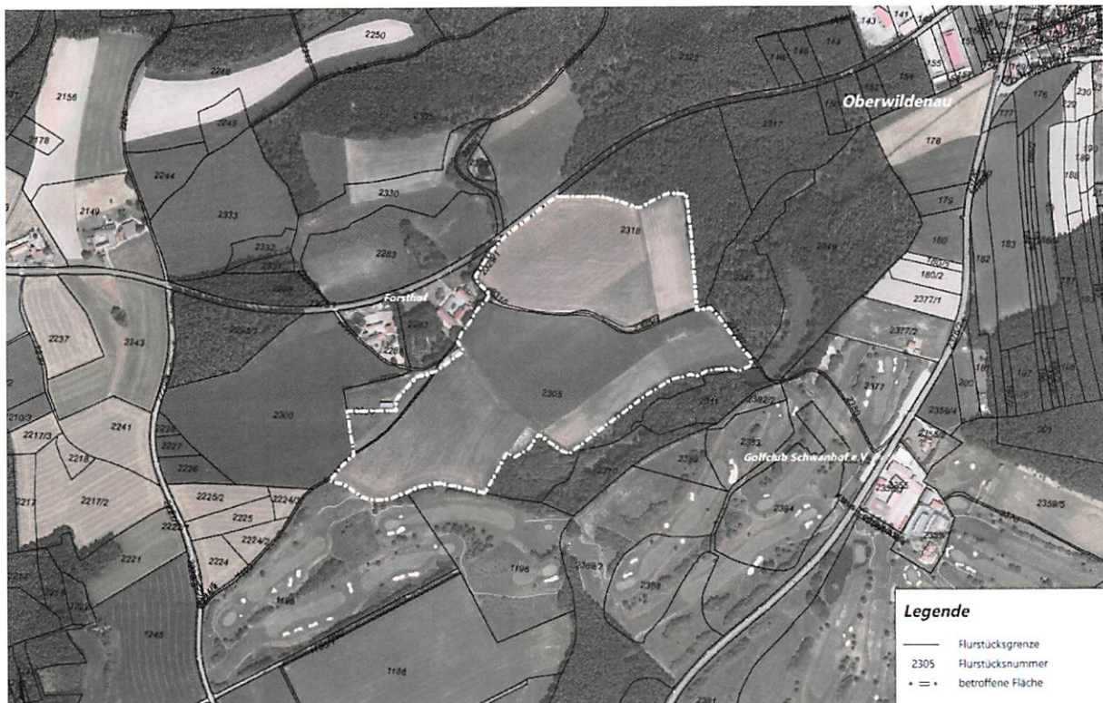
Lageplan des Plangebietes

Das Plangebiet hat eine Größe von ca. 23,3 ha und liegt südwestlich von Oberwildenau. Es umfasst die Flurstücke 2304 (TF), 2305 (TF), 2305/1, 2316 (TF), 2318 (TF) der Gemarkung Oberwildenau. Die Lage und der Flächenumfang sind dem beigefügten Lageplan zu entnehmen.