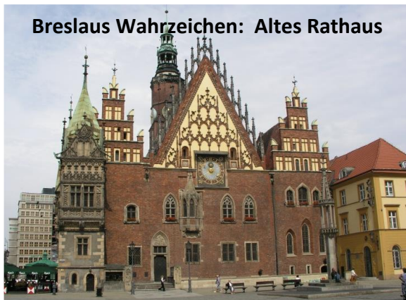
Breslau Wahrzeichen: Altes Rathaus